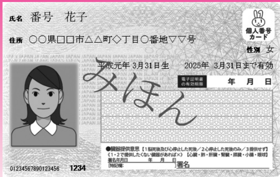
マイナンバーカード見本

マイナンバーカードをマイナ保険証として利用するためには登録作業が必要ですが、当院にある顔認証付きカードリーダーでも登録ができますので、ぜひご利用ください。