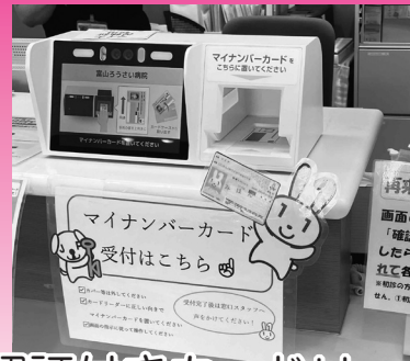
顔認証付きカードリーダー (当院総合受付)